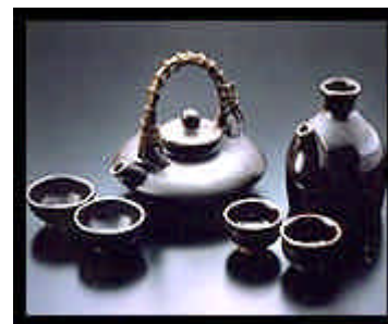
お問合せの多い「黒ジョカ」

最近焼酎のお問合せも然ることながら、焼酎を飲むための器に関してもお問合せが多くなっています。「黒ジョカ」「ガラとチョク」「ソラキュウ」「カラカラ」「薩摩切子」等、焼酎をより美味しく、そして雰囲気を出して頂ける為の酒器がたくさんありますよね。焼酎紀行HPの「焼酎を楽しもう」のページで詳しくご紹介していますので、ぜひご覧になって下さい。