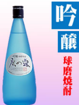
米焼酎 吟醸 房の露