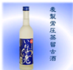
麦焼酎 いねむり兎