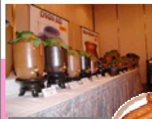
焼酎以外にも壺壺やおつまみもありました。