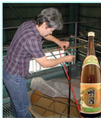
【女性・香りを意識した焼酎】

明治 24 年創業の明石酒造は、宮崎県えびの市に蔵を構える年間生産 6,000 石の蔵元です。明石酒造では、えびの地方の自然の恵みを受けて芋・麦・米を原料に様々な焼酎を造っています。その焼酎造りに携わっている方の半分は女性ということで、原料である芋の皮むき、自社栽培している麴米（ヒノヒカリ）の田植えやもろみへのかい入れ、出来上がった焼酎の試飲、研究などあらゆる部分で女性が活躍しています。