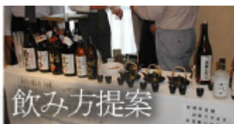
飲み方提案 様々な飲み方をご提案