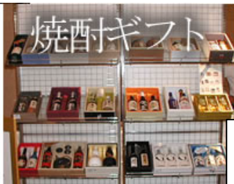
お歳暮に向けて焼酎の ギフトをご提案