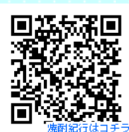
焼酎紀行はコチラ